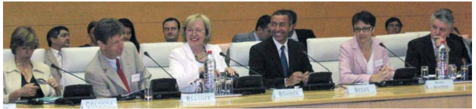
Beteiligten sich am intensiven deutsch-französischen Informations- und Erfahrungsaustausch zur Frage der Integration von Migranten: prominente Vertreter Frankreichs und Deutschlands beim Forum guter Praxisbeispiele am 18. Juli 2006 in Paris

Inhaltlich setzte die Konferenz zwei Schwerpunkte: die Sicherung von Chancengleichheit und Integration beim Zugang zum Arbeitsmarkt sowie Integration und Chancengleichheit vor Ort, also auf kommunaler Ebene. Auf deutscher Seite wurden insbesondere Projekte vorgestellt, welche die Sprachbeherrschung sowie die berufliche Qualifizierung der Migranten verbessern (Deutschkurse speziell für Mütter; gezielte Förderung von Hauptschulen, welche gerade deshalb erfolgreich ist, weil Migranten nicht als gesonderte Gruppe behandelt werden; Ausbildung ehrenamtlicher Tutoren, die in Brennpunktvierteln Grundschüler aus Einwandererfamilien begleiten).