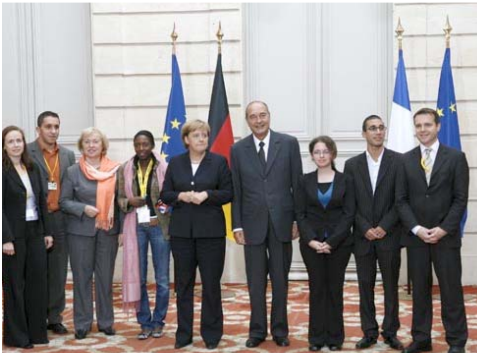
Am Rande des deutsch-französischen Ministerrats: Bundeskanzlerin Merkel und Präsident Chirac treffen Studierende mit Migrationshintergrund. Integration und Chancengleichheit waren wesentliche Themen der Gespräche in Paris.

rungen beschäftigt, wurde am vergangenen Donnerstag ausführlich behandelt (vgl. dazu auch das Internet-Angebot des französischen Staatspräsidenten ): „Integration und Chancengleichheit“. Im Unterschied zu den Themen der Tagesaktualität geht es hierbei darum, einen breiten gesellschaftlichen Diskussionsprozess in Gang zu setzen. Um die Reflexion über Lösungsansätze für die zahlreichen offenen Fragen der Integration und Chancengleichheit voranzubringen, sollen und müssen möglichst