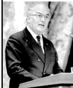
Rainer Barzel † (1924–2006)

Das Deutsch-Französische Institut trauert um seinen ehemaligen Präsidenten Rainer Barzel, der am 26. August 2006 im Alter von 82 Jahren verstorben ist.