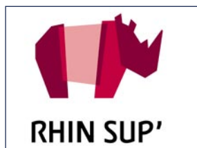
RHINO Logo.

Rhino est une initiative de la société civile. Il est issu d'un concours d'idées des écoles des Beaux Arts de Mulhouse, Karlsruhe et Bâle. La Fondation Entente franco-alle-