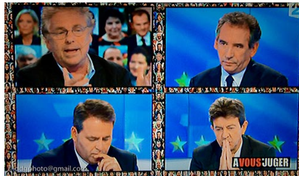
Daniel Cohn-Bendit, Europe Ecologie ; François Bayrou, président du MoDem ; Xavier Bertrand, Secrétaire général de l'UMP ; Jean-Luc Mélenchon, Front de Gauche.

nes. Dès le début de la construction européenne, les États-nations ont joué un rôle considérable et continuent de le jouer. Des enjeux européens, il y en a pléthore, et on s'en sent tous concernés : la sécurité énergétique, le changement climatique, la gestion des flux migratoires, la régulation des marchés financiers, la défense européenne. Ils jouissent d'une telle évidence pour être importants qu'on est à la fois tous d'accord et... désenchantés, puisqu'on est encore loin d'une véritable politisation