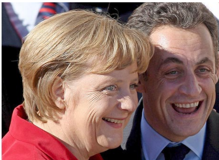
Nicolas Sarkozy et Angela Merkel lors de la célébration du 11 novembre 2009 à Paris.

Les relations franco-allemandes empreintes d'asymétries