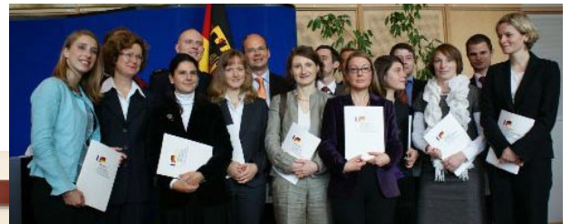
Image du haut : Remise des diplômes à la quatrième promotion à Berlin. Image de gauche : Lancement de la cinquième promotion à Paris.

Le MEGA est organisé depuis 2005 sous l'égide du Ministère Fédéral allemand de l'intérieur et du Ministère français du Budget, des Comptes publics et de la Fonction publique, en partenariat avec l'Université Paris 1 Panthéon-Sorbonne, Sciences Po, l'Université de Potsdam/PCPM