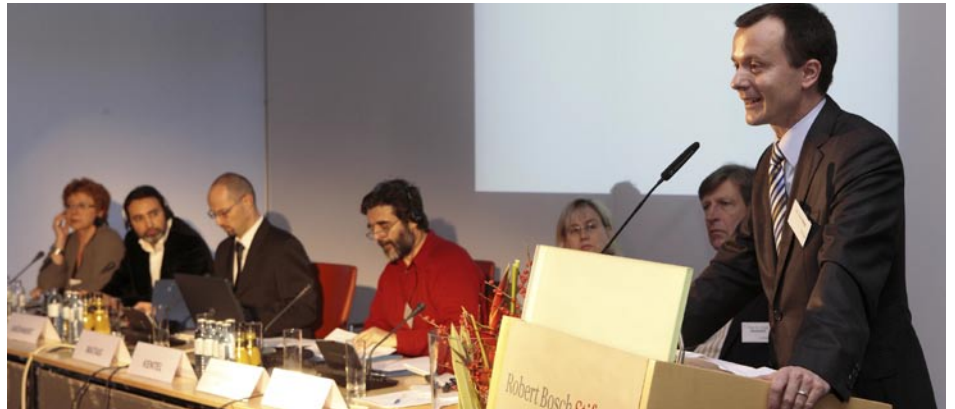
Podium d'ouverture.

Les discussions entre la centaine de participants réunis ont tourné principalement autour de la problématique du succès et de l'échec scolaire, ainsi que du rôle des entreprises turques. Globalement il a été démontré, en dépit