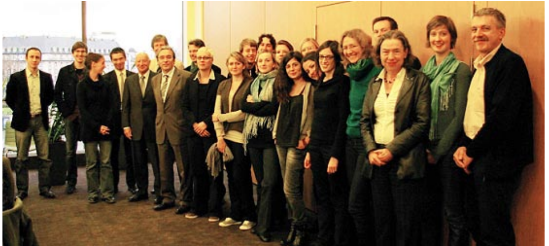
(d.g.à.d.) Jeunes journalistes français et allemands en formation avec Roland Ries, maire de Strasbourg.

La troisième édition du séminaire pour jeunes journalistes français et allemands s'est tenue du 29 novembre au 2 décembre 2009 à Strasbourg et à Rust, dans le cadre du programme de la fondation Robert Bosch. Point fort de cette rencontre, les participants ont pu échanger leurs expériences respectives, celles des Français au sein des médias allemands (presse, radio, télévision, internet) et celles des Allemands pendant leur stage dans les rédactions françaises. A quoi ressemble une journée de travail type ? Comment se déroule une conférence de rédaction, comment sont hiérarchisées les structures décisionnelles et de quelle façon le journalisme peut-il se montrer critique ? Il s'est souvent avéré que les différences quant au style de communication et à la hiérarchie dans les rédac-