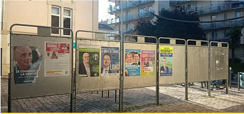
Wahlplakatwand im Departement Marne.

Patronats glaube, einen RN an der Macht zähmen und ihn für die Interessen der Arbeitgeberseite gewinnen zu können.