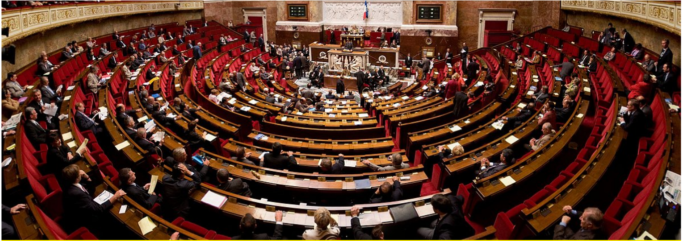
Panorama des Plenarsaals der Nationalversammlung