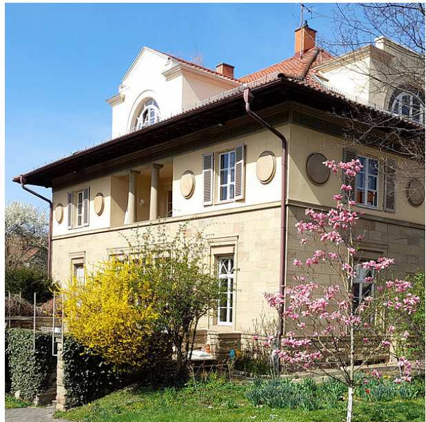
Villa Frischauer: Hauptsitz des Deutsch-Französischen Instituts in Ludwigsburg