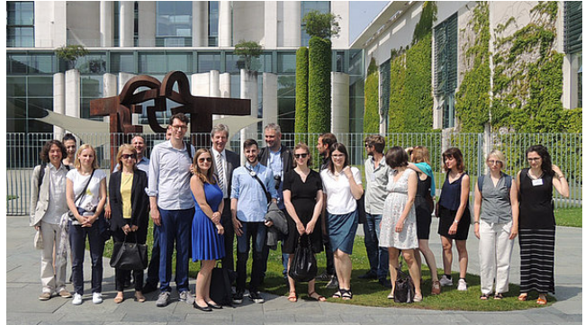
Journalistinnen und Journalisten aus Frankreich, Deutschland, Italien und Polen auf Studienreise durch die vier Länder