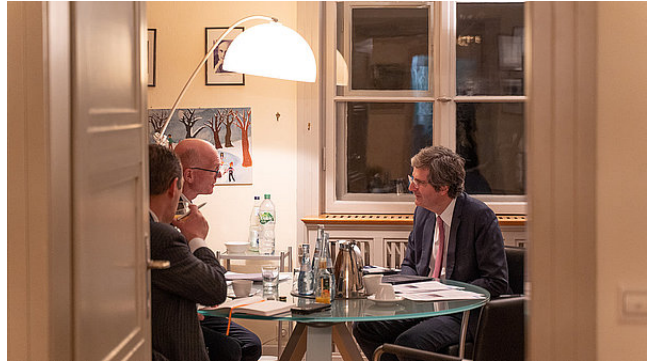
Der Botschafter im Gespräch mit der Presse

fostering understanding for the respective national perspectives: This is where our work comes in. With a high media exposure (on average 200 mentions annually), we contribute to political and social debate.