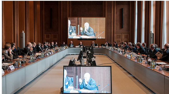
Fachkonferenz mit deutschen und französischen Ökonomen im Bundesfinanzministerium mit Minister Wolfgang Schäuble