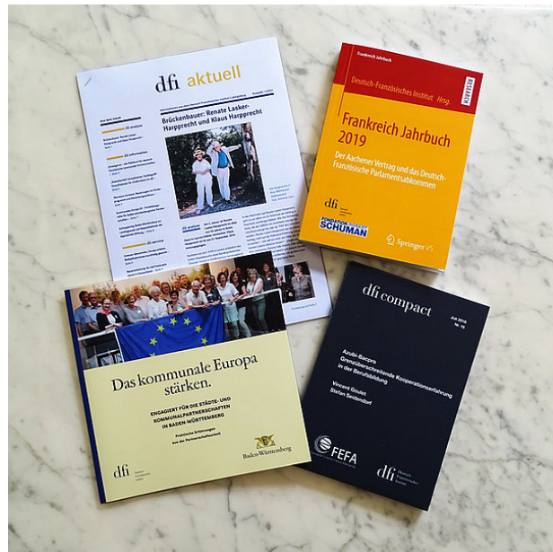
Verschiedene Publikationen des dfi