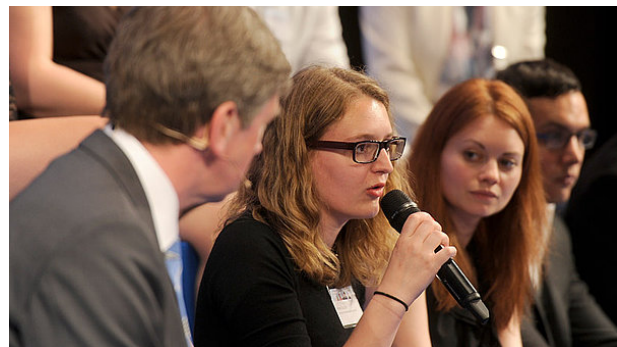
Junge Europäer diskutieren ihre Erwartungen an die Zukunft der EU