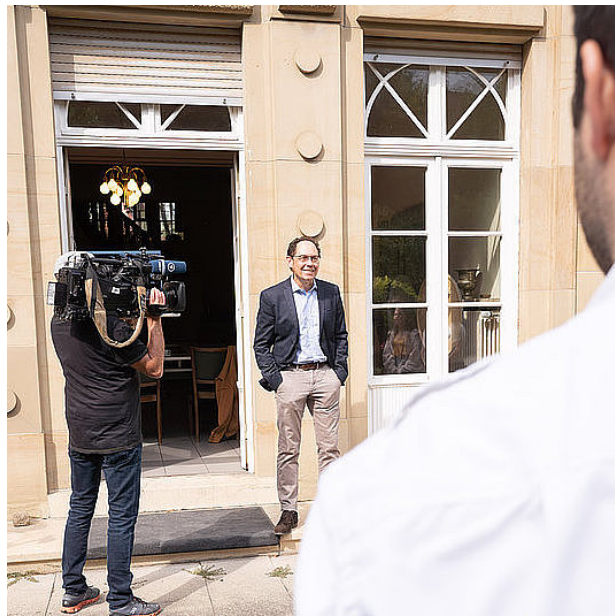
Jugendliche des De Gaulle Wettbewerb zu Gast beim dfi