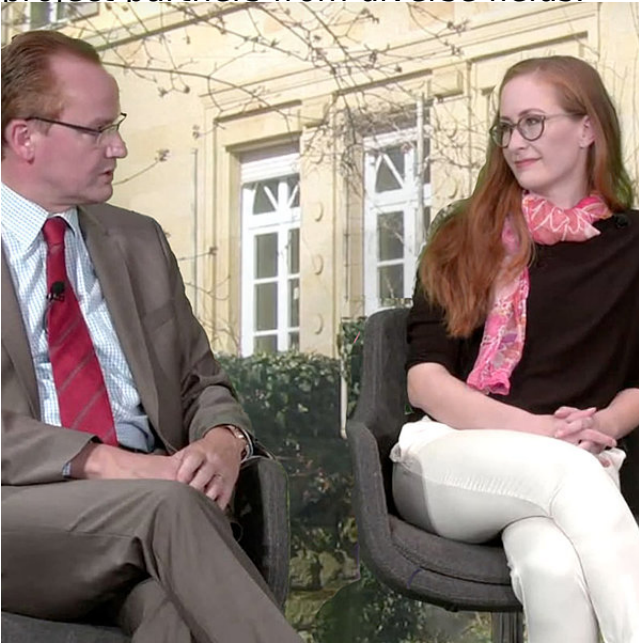
„dfi journal“, ein neues Format neben Radio- und Fernseh-Interviews

International cooperation has to be learned – this applies to Franco-German cooperation, too. With many years of experience, we can support project partners from diverse fields.