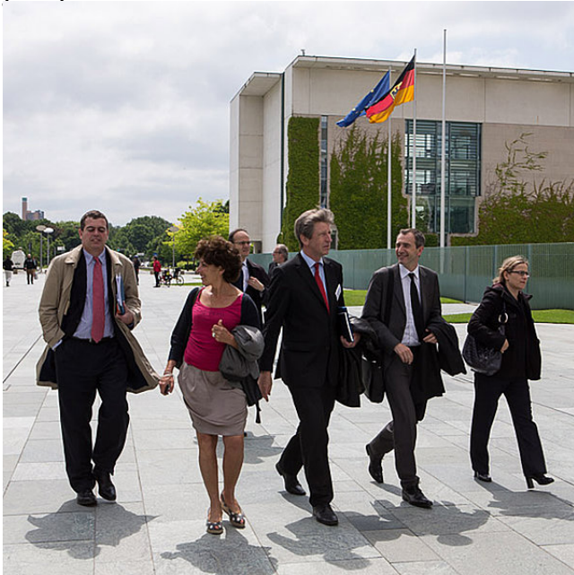
Eine Gruppe französischer Journalistinnen und Journalisten vor dem Bundeskanzleramt

The mutual perception between the French and Germans is always in peril of becoming stuck in stereotypical images through one-sided information, biased perception and hasty judgement.