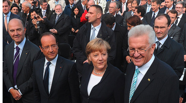
50-Jahr-Feier der Rede de Gaulles an die deutsche Jugend: Bernard Cazeneuve, Pierre Moscovici, François Hollande, Angela Merkel und Winfried Kretschmann (v.l.n.r.)

“The Franco-German friendship is the best example of how decades of conflict and animosity can be overcome. But it needs the political will to do so”