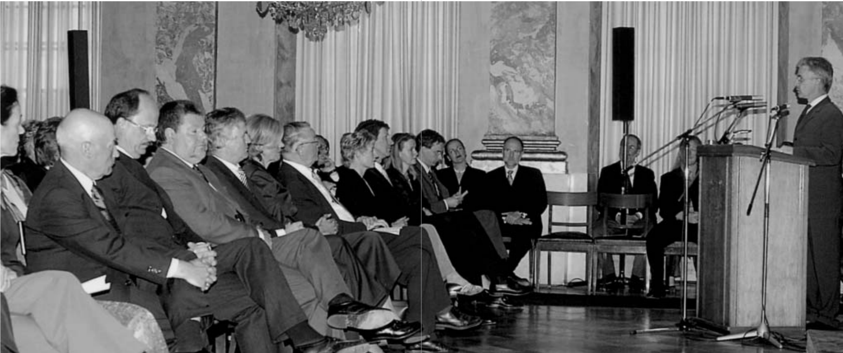
Festveranstaltung aus Anlass der Amtsübergabe im Ordenssaal des Residenzschlosses Ludwigsburg am 14. Mai 2002