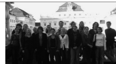
Seminar für deutsche und französische Studenten „Deutsch- land und Frankreich nach Referendum und Bundestagswahl – Politik, Wirtschaft und Soziales im Vergleich“, Ludwigsburg