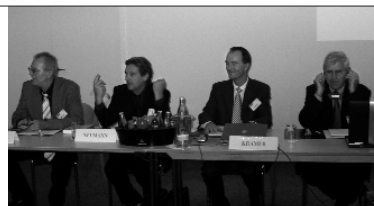
Konferenz „Demographischer Wandel und Kommunalpolitik in Frankreich und Deutschland“, in Zusammenarbeit mit der Wüstenrot Stiftung, Ludwigsburg