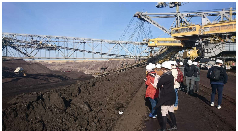
Noch gibt es Braunkohleabbau in der Lausitz: geführte Tour durch den Tagebau Welzow-Süd

Mit dem endgültigen Kohleausstieg bis spätestens 2038 wird die Lausitz nun einen dritten Strukturbruch erleben, denn trotz der Veränderungen, die in den 1990er Jahren eingesetzt haben, trägt die Braunkohleindustrie bis heute immer noch 30 % zur regionalen Wirtschaftsleistung bei. Zur Bewältigung des Wandels sollen auch Gelder vom Bund beitragen (insgesamt 40 Milliarden Euro), die anteilig in alle Kohleregionen Deutschlands fließen. Die brandenburgische Lausitz mit Cottbus als Zentrum kann mit rund 17 Milliarden rechnen.