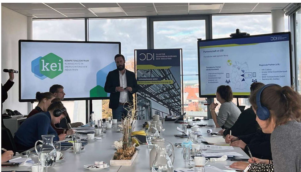
Im Kompetenzzentrum Klimaschutz in energieintensiven Industrien (KEI)