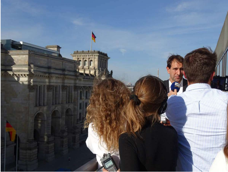
Interview mit Andreas Jung, energie- und klimapolitischer Sprecher der CDU/CSU-Bundestagsfraktion

Vom 16. bis 21. Oktober reiste die Gruppe mit dem dfi nach Berlin und Cottbus, um sich im Kontext von Energiekrise und geplantem Kohleausstieg über Strategien zur Förderung der wirtschaftlichen Entwicklung zu informieren.