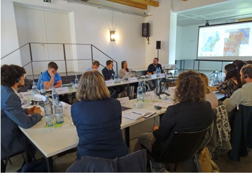
Die Teilnehmer*innen

Akteure sowie auf Sektoren, in denen die Bodenseeregion und die Region um Saint-Dié-des-Vosges besonders betroffen sind, wie die Landwirtschaft oder auch die Wasser- und Waldbewirtschaftung.