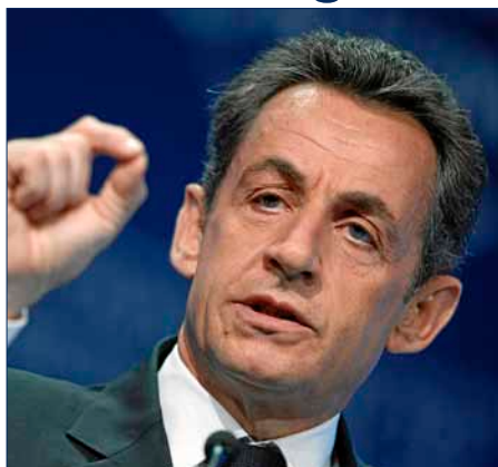
Nicolas Sarkozy : peut-il encore y arriver ?