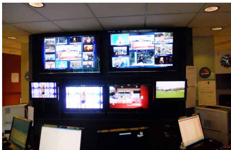
Jeunes Journalistes 2011, en visite à TF1

Comme les années précédentes, la Fondation Robert Bosch finance la participation de 20 journalistes à un programme comprenant trois séminaires (à Berlin, Paris et Strasbourg) et un stage dans le pays voisin (en France ou en Allemagne selon la nationalité). L'objectif est de fournir aux jeunes journalistes une présentation de première main du système et du paysage politique, économique, social et médiatique de l'autre pays ainsi que de nouer des contacts utiles. Les participants de la promotion 2012 ont été sélectionnés ; ces derniers proviennent de différentes écoles françaises de journalisme reconnues par la profession, de l'école allemande de journa-