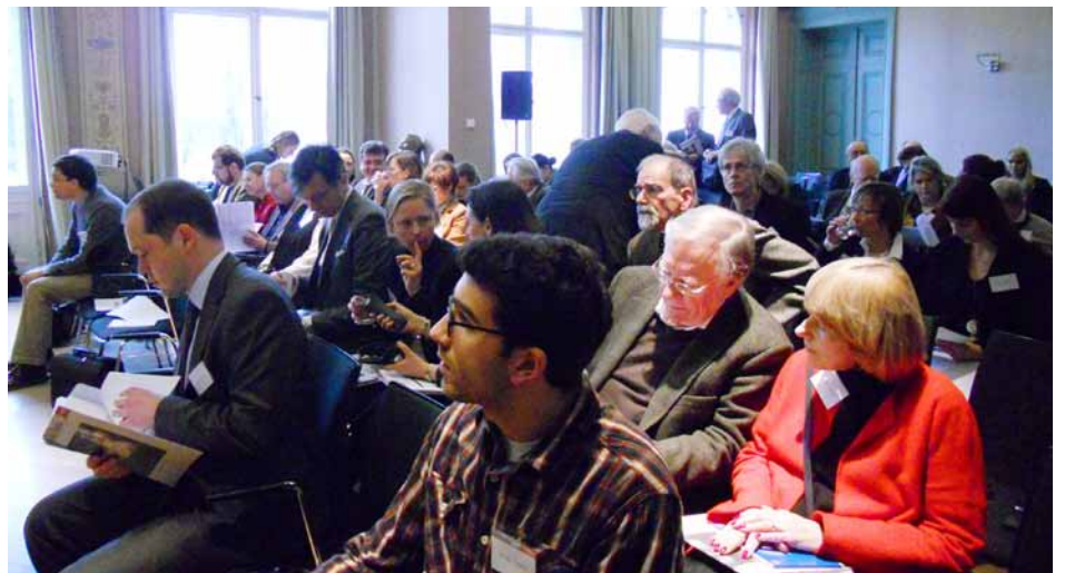
Des participants lors de la présentation du projet.