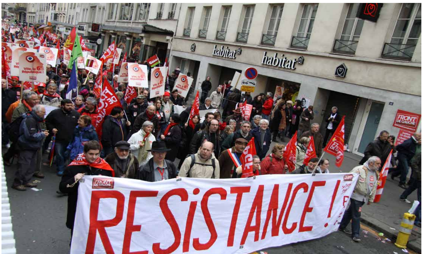
Manifestation : une tradition française.