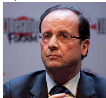
François Hollande : réussira-t-il à prendre le pouvoir ?