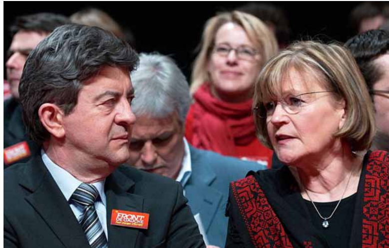
Jean-Luc Mélenchon et la communiste Marie-George Buffet : la gauche fait pression.

D'une certaine manière, la France d'aujourd'hui ressemble à l'Allemagne d'il y a dix ans, lorsqu'elle était qualifiée d'« homme malade de l'Europe », incapable de mener les réformes et changements nécessaires. La France a-t-elle aujourd'hui besoin d'un « Agenda 2020 » sur le modèle de l'« Agenda 2010 » du chancelier Schröder ? Certainement. Pourtant, l'utilisation galvaudée par Nicolas Sarkozy et une partie des media du « modèle allemand » à suivre a été contre-productive car cette instrumentalisation du modèle du voisin à des fins partisans a inévitablement déclenché des réflexes contraires. Surtout, le modèle allemand n'est ni idéal ni exportable tel quel. Chaque pays doit trouver des réponses adaptées à sa culture, à même d'assurer stabilité et croissance, solidarité sociale et solidité financière. Et ce faisant, les priorités seront