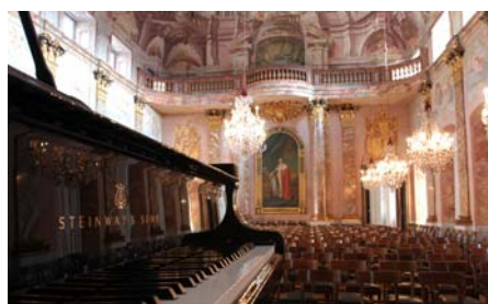
Ordenssaal im Residenzschloss Ludwigsburg

Besonderheiten. Ist die Idee Europas angesichts der weltweiten Vernetzung also längst überholt? ZEIT-Herausgeber Josef Joffe diskutiert mit hochkarätigen Gesprächspartnern, woraus eine euro-