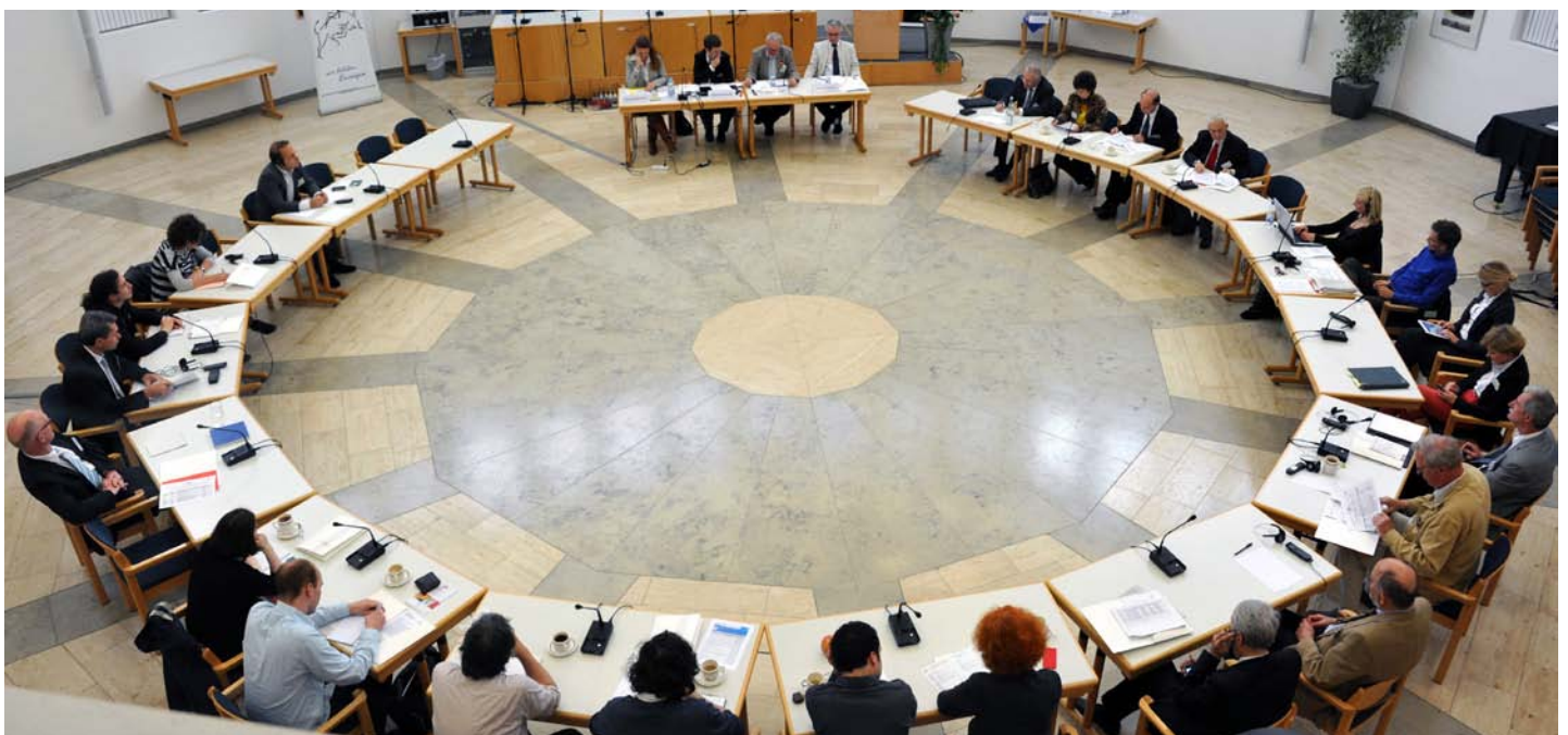
Panoramabild vom Deutsch-Französischen Dialog 2012.