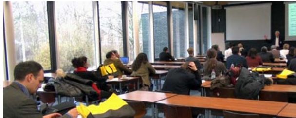
Forschungsatelier „Staatspolitiken im Vergleich“, März 2013, Speyer.

Gemeinsam mit der Robert Bosch Stiftung fördert die DFH in diesem Jahr eine Reihe von vier mehrteiligen Forschungsateliers zum Thema