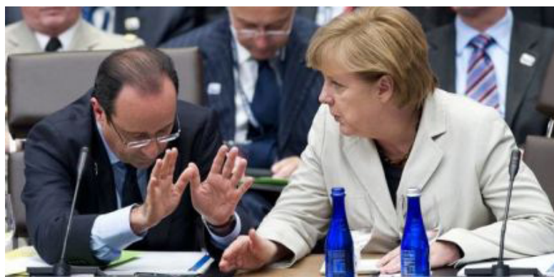
„Freundschaftliche Spannung“: François Hollande und Angela Merkel.