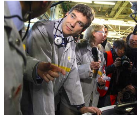
Industrieminister Arnaud Montebourg kritisiert den Sparkurs von Präsident François Hollande.

formen jahrelang verschleppt und blockiert worden? Einsparungen oder Strukturreformen, die Veränderungen und Einschnitte bei Leistungen oder Subventionen mit sich bringen, also tradierte Interessen infrage stellen, sind auch in Deutschland ein schwieriges, politisch zuweilen gefährliches Unterfangen. Deshalb liegt es im deutschen Interesse, dass der französische Präsident mit seinem Reform- und Konsolidierungskurs mittelfristig Erfolg hat, auch wenn die Fortschritte kurzfristig noch ausbleiben. Bei allem Lamento darüber, dass Frankreich es in diesem Jahr nicht schaffen wird, die Neuverschuldung auf die angestrebten 3 % zu drücken: Wichtiger ist, dass Maßnahmen und Reformen umgesetzt werden, die Frankreichs öffentliche Finanzen dauerhaft konsolidieren.