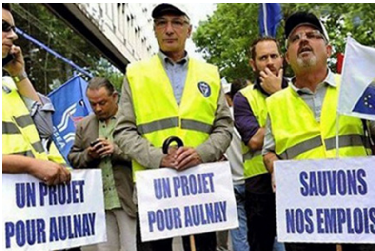
Mitarbeiter von Peugeot in Aulnay-sous-Bois im Streik.