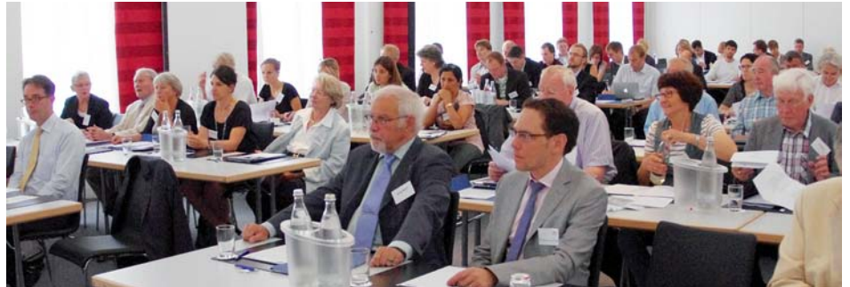
Jahrestagung 2012.

Ein knappes Jahr nach der Wahl François Hollandes ist die Aufbruchstimmung verfliegen. Die Hoffnung auf den „Wandel“ hat einer tiefen Krisenstimmung und Resignation Platz gemacht. Die Symptome heißen Wachstumsschwäche, Arbeitslosigkeit, hohe öffentliche Defizite, soziale Krise; die Diagnosen sind entsprechend pessimistisch. Hollande steht vor der Aufgabe, Zeichen der sozialen Gerechtigkeit und des Aufbruchs zu setzen und gleichzeitig schwierige Reformen einzuleiten, um die Wirtschaft wettbewerbsfähiger und den Sozialstaat zukunftssicherer zu machen. Wohin steuert unser Nachbarland? Die XXIX. Jahrestagung will die gesell-