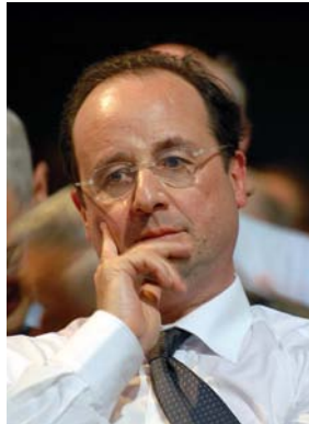
François Hollande steht in der Kritik.

Und Deutschland? Es hat in den vergangenen Wochen und Monaten in den Medien, aber auch in der Politik, viele Besserwisser gegeben, die entweder vom Absturz Frankreichs schwadronierten oder aber gönnerhafte Belehrungen von sich gaben – etwa die, Frankreich benötige eine „Agenda 2010“ nach Schröders Vorbild von 2003. Oft ist noch nicht einmal der Reformkurs des französischen Präsidenten zur Kenntnis genommen worden. Etwas mehr Demut täte der Debatte gut! Galt nicht auch Deutschland vor gut zehn Jahren als der „kranke Mann Europas“, waren nicht längst als notwendig erkannte Re-