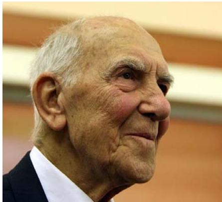
Stéphane Hessel, 1917 – 2013.

Wie viele der Überlebenden, wurde auch Hessel bis ins Alter von Alpträumen aus seiner Zeit im KZ verfolgt. Sein „Gegenmittel“ war es, sich an die Kameraden und Mithäftlinge zu erinnern – und so die Täter zu vergessen. Für