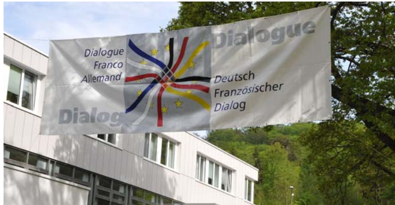
Europäische Akademie Otzenhausen

Die Rede ist von einem wesentlichen Diskussionspunkt, der in allen Debatten um die Finalität der europäischen Integration seit Jahrzehnten immer wieder auftaucht: Die Frage nach einem föderal verfassten Europa. Während der Begriff und das Konzept des Föderalismus in Deutschland ein wesentlicher Teil des verfassungspolitischen Selbstverständnisses darstellen, regierten die französischen Eliten lange Zeit mit Skepsis, Unverständnis oder gar offener Ablehnung. Die fundamentalen Unterschiede mit Blick auf die