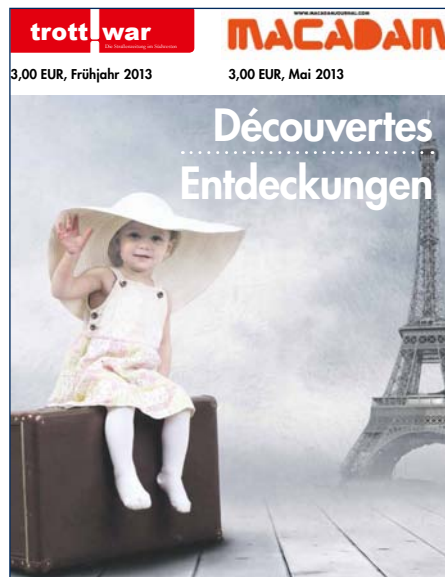
Sonderausgabe von Trott-war – Macadam

Diese ungewöhnliche Kooperation ist das Ergebnis vieler Akteure: Beteiligt waren neben den