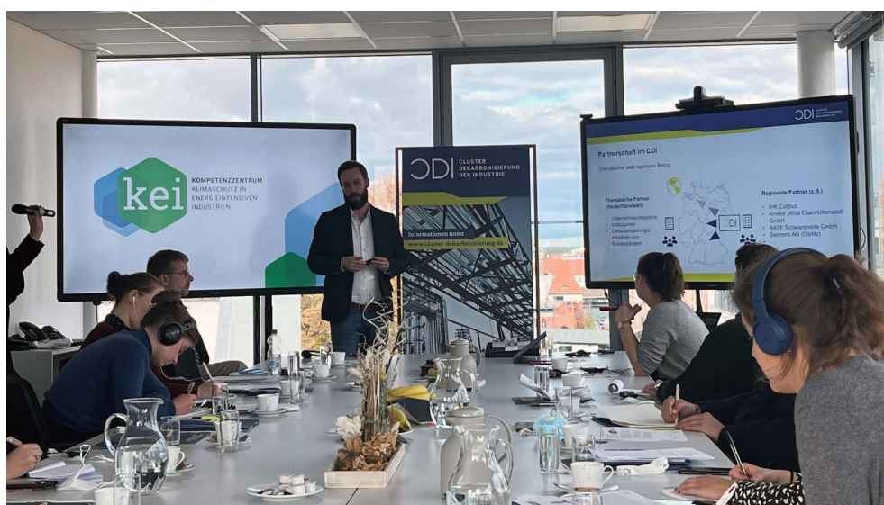
Au centre de compétence pour la protection du climat dans les industries à forte consommation d'énergie (KEI)