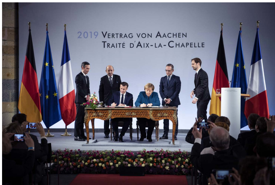
La chancelière allemande Angela Merkel et le président français Emmanuel Macron lors de la signature du « traité d'Aix-la-Chapelle » sur la coopération et l'intégration franco-allemande.