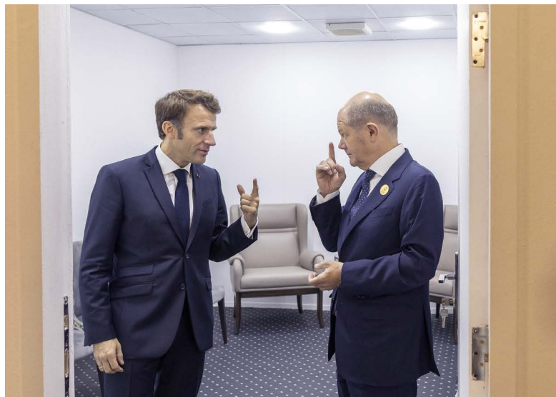
Tête-à-tête entre le chancelier allemand Olaf Scholz (à droite) et le président français Emmanuel Macron en marge de la 27 e Conférence mondiale des Nations unies sur le climat (COP27), au Centre international des congrès (SHICC).

dfi analyse Depuis le discours du chancelier Scholz sur le « changement d'époque » ( Zeitenwende ) en février 2022, une chose est sûre : les défis évoqués par Olaf Scholz pèsent lourdement sur la politique européenne. Cela touche également la relation franco-allemande. Le 19 octobre, il a été décidé à la dernière minute de reporter le « Conseil des ministres franco-allemand » qui était prévu le 26 octobre.