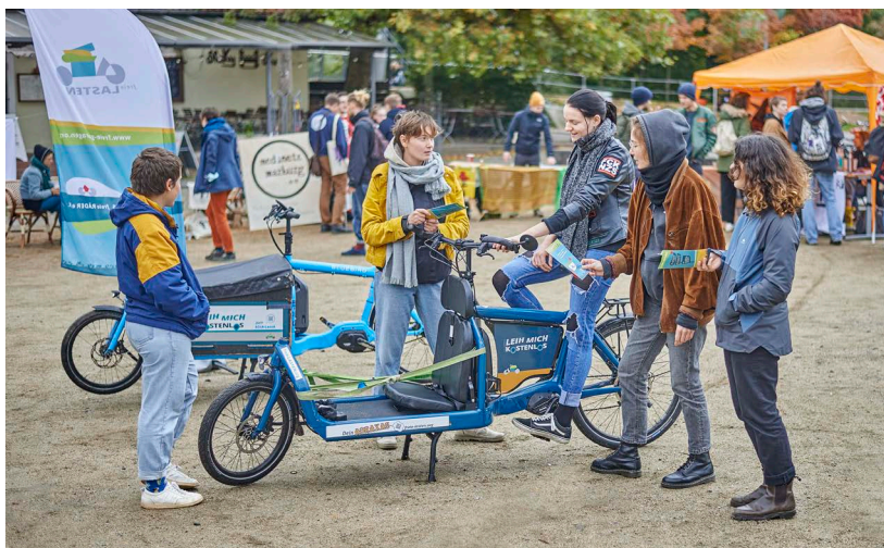
Mobilité durable : l'association « freie LASTEN » met des vélos-cargos en libre-service dans différents endroits de la ville de Marbourg.