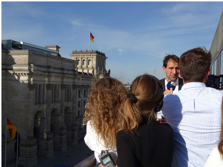
Interview avec Andreas Jung, porte-parole du groupe CDU/CSU au Bundestag, sur la politique énergétique et climatique

Du 16 au 21 octobre, neuf jeunes journalistes français se sont rendus à Berlin et en Basse-Lusace avec le dfi pour s'informer sur les stratégies de développement économique dans le contexte de la crise énergétique et de la sortie du charbon.