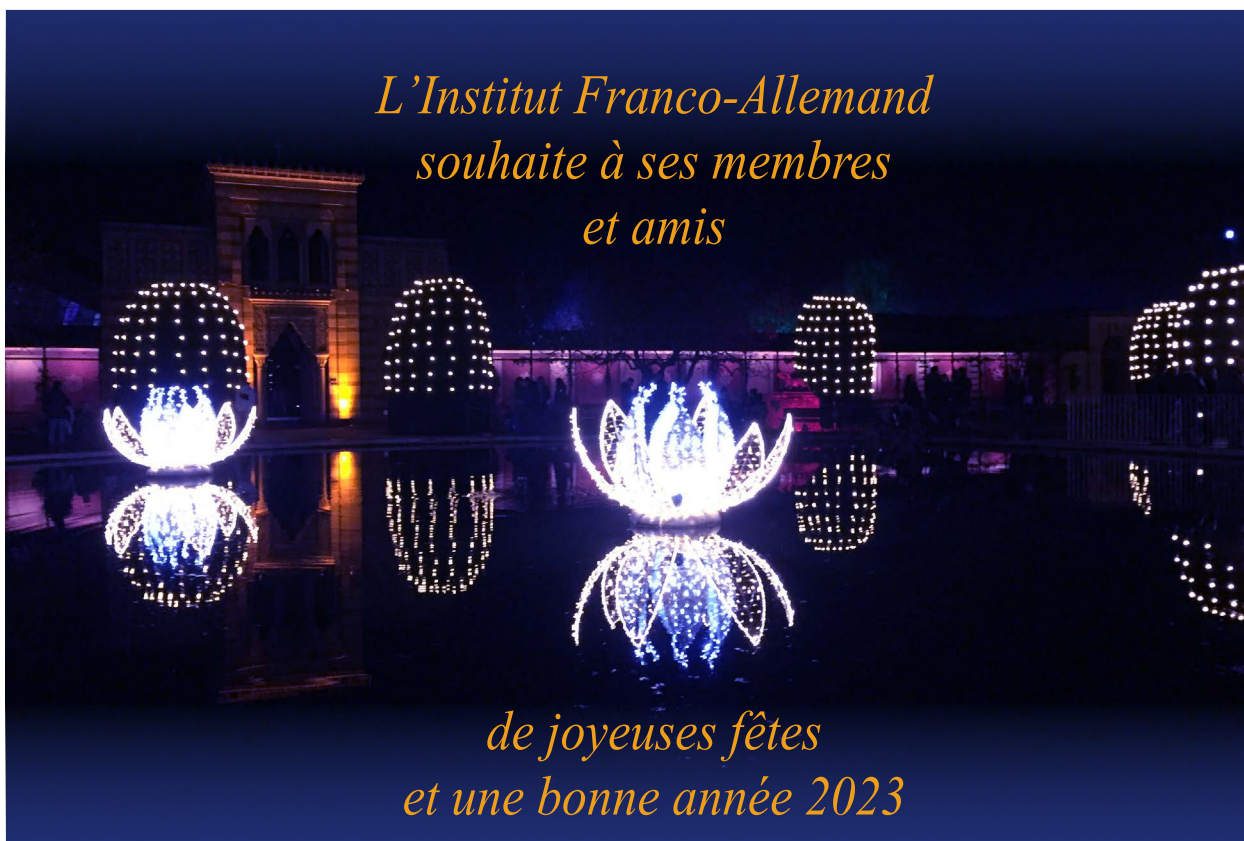
Christmas Garden à la Wilhelm, Stuttgart