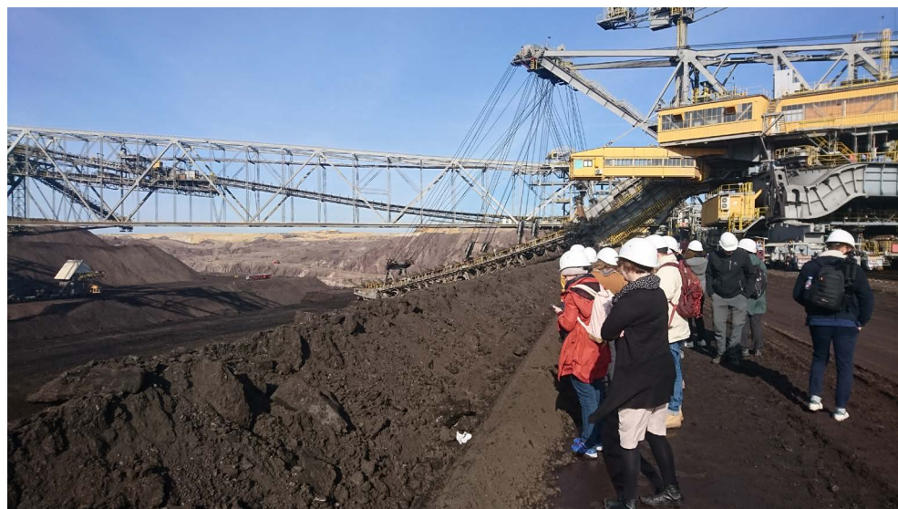
La Lusace exploite encore le lignite : visite guidée de la mine à ciel ouvert de Welzow-Sud.

Avec l'abandon définitif du charbon d'ici 2038 au plus tard, la Lusace va maintenant connaître une troisième rupture structurelle, car malgré les changements qui ont commencé dans les années 1990, l'industrie du lignite contribue encore aujourd'hui à 30 % de la performance économique régionale. Des fonds de l'Etat fédéral