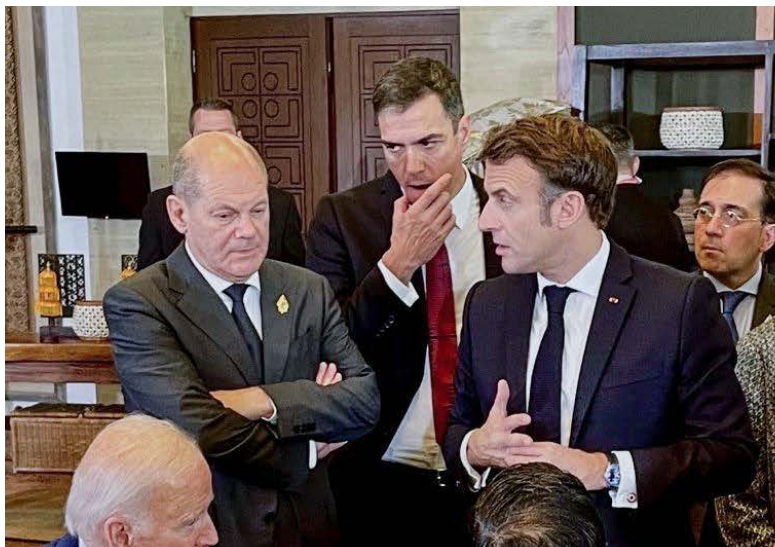
Le chancelier allemand Olaf Scholz et le président français Emmanuel Macron lors d'un entretien sur la frappe de missiles dans l'est de la Pologne en marge du sommet du G20 à l'hôtel

l'Union européenne et au-delà. Il s'agirait alors d'un autre tournant, d'une Zeitenwende franco-allemande.