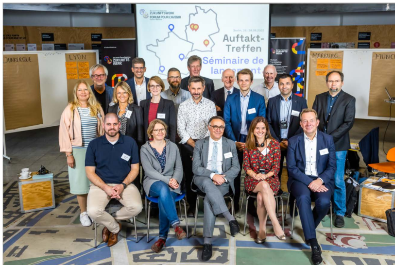
Séminaire de lancement à Berlin septembre 2022

L'enjeu central de toutes les études est de comprendre dans quelles conditions les changements nécessaires, indispensables pour atteindre les objectifs climatiques fixés par l'UE et les États nationaux, peuvent être réalisés au mieux. Pour ce faire, le Forum s'est concentré sur les stratégies efficaces qui ont fait leurs preuves, tout en identifiant les blocages administratifs ou réglementaires.