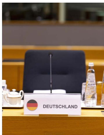
Siège du chancelier fédéral lors d'un Conseil européen dans le bâtiment Europa

Shield Initiative ) portée par 15 ministres de la Défense membres de l'OTAN, mais proposée et décidée sans la France. En France, on craint que l'Allemagne n'emprunte de plus en plus la voie de la moindre résistance pour faire prévaloir ses intérêts à court terme, avec l'aide de partenaires qui n'ont pas son poids et qui peuvent changer au gré des constellations. À Berlin, il faudrait se rappeler à l'évidence que vouloir bâtir la sécurité et la défense de l'Europe sur la base d'une telle coalition de pays entraînés par l'Allemagne ne constitue pas encore une politique de l'UE en la matière – car la France, du moins, a d'autres conceptions stratégiques qui devraient également être prises en compte.