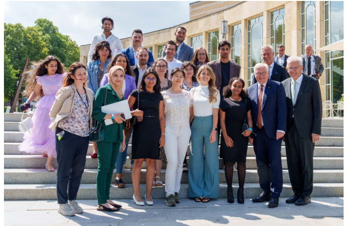
Ein Teil der Jugendlichen der Zukunftskonferenz mit Frank-Walter Steinmeier und Winfried Kretschmann