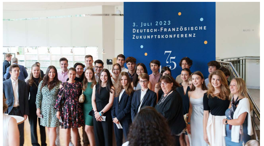
Schülerinnen und Schüler