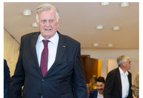
Ehrgast: der frühere Ministerpräsident von Baden-Württemberg und ehemalige Präsident des dfi, Erwin Teufel