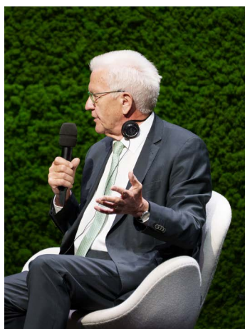
Ministerpräsident Winfried Kretschmann im Zusammenhang mit den großen Zukunftsthemen wie Nachhaltigkeit: „[...] aus solchen Fragen keine Kulturkämpfe machen. Wenn man das macht [...] setzt man Spaltungselemente in die Gesellschaft.“