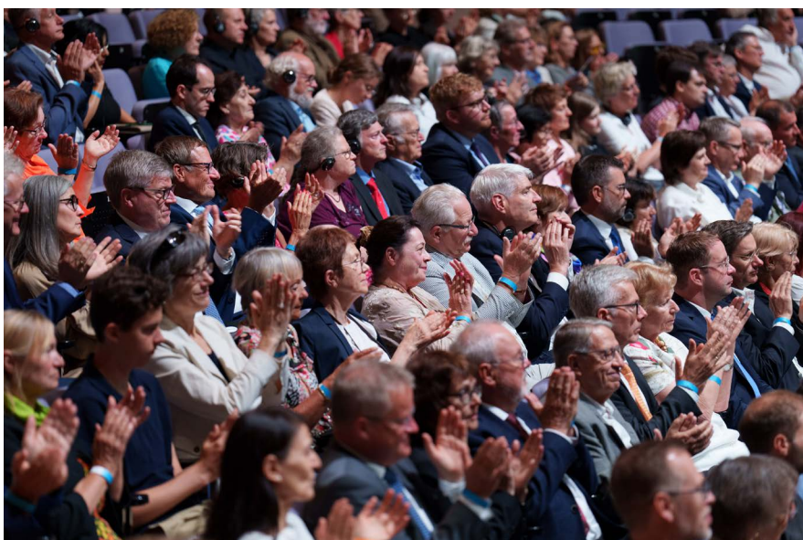
Das Publikum im Forum am Schlosspark, Ludwigsburg