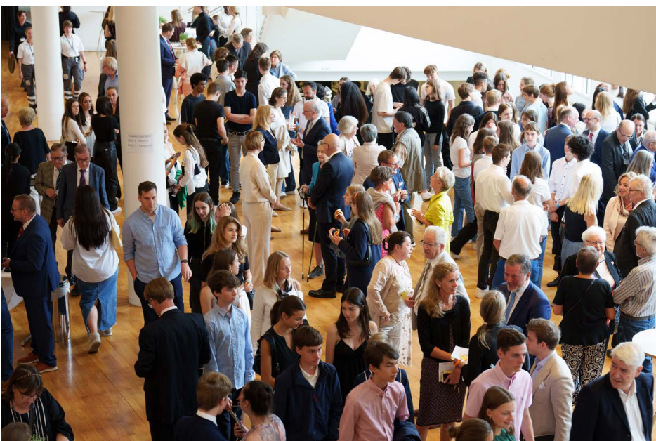
Auf dem Empfang nach der Veranstaltung