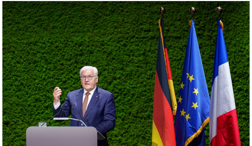
Bundespräsident Frank-Walter Steinmeier bei seiner Ansprache: „Heute ist unsere Freundschaft in allen Bereichen des Lebens so tief verankert, dass sie uns so selbstverständlich ist wie das Atmen.“