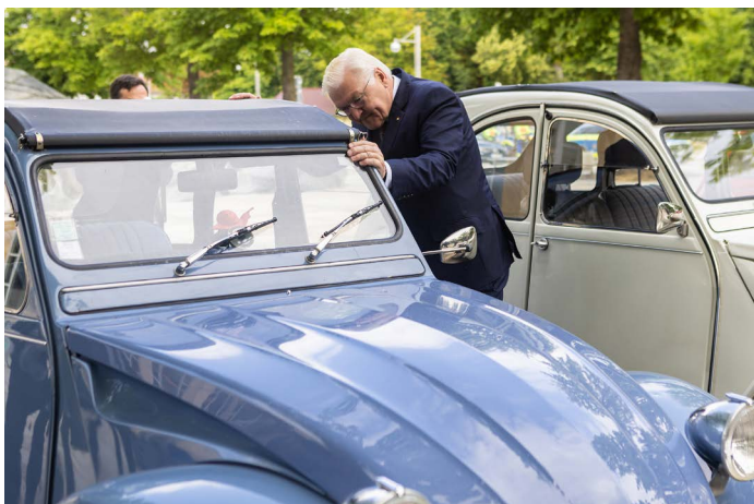
Der Bundespräsident freut sich über die Enten.