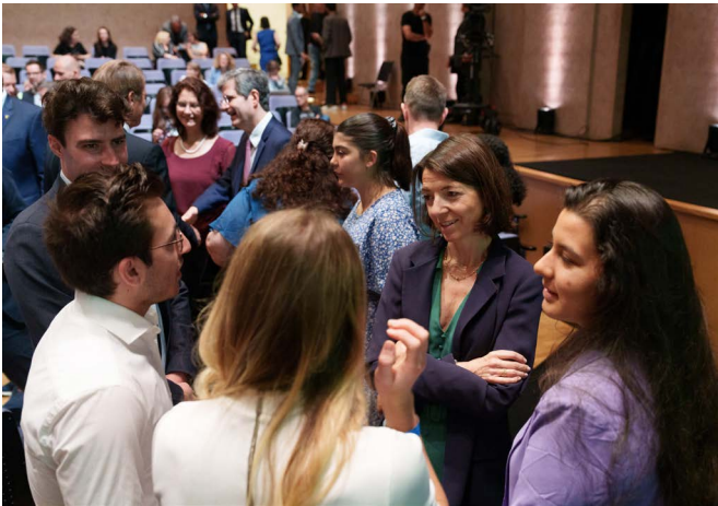
Laurence Boone, hier im Gespräch mit Jugendlichen: „Wir Franzosen müssen uns viel mehr um die europäische und die deutsche Kultur bemühen. Wir fahren viel zu selten in den Urlaub nach Deutschland, das ist schade. Es gibt den Schwarzwald, es gibt die Berge, es gibt Berlin, es gibt Städte, es gibt das Meer. Wenn wir Franzosen in die Oper gehen, hören wir sicher nicht genug Wagner. Wir Franzosen lesen nicht auf Deutsch, und es ist immer schwierig, eine Kultur wirklich zu verstehen, wenn man nicht in die Sprache eintaucht.“