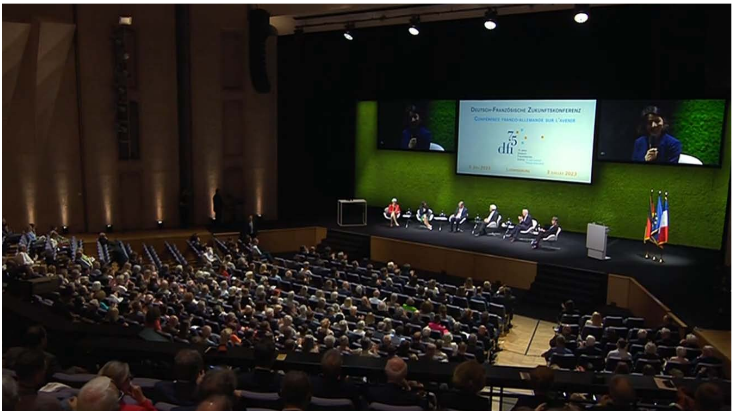
Blick in den Theatersaal des Forum am Schlosspark, Ludwigsburg