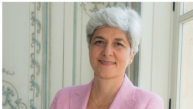
INTERLOCUTEUR · RICE