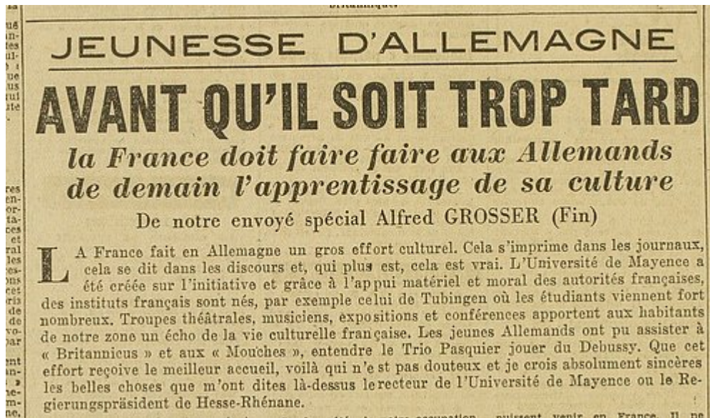
Début d'un article d'Alfred Grosser sur la jeunesse allemande dans le journal Combat du 31.10.1947