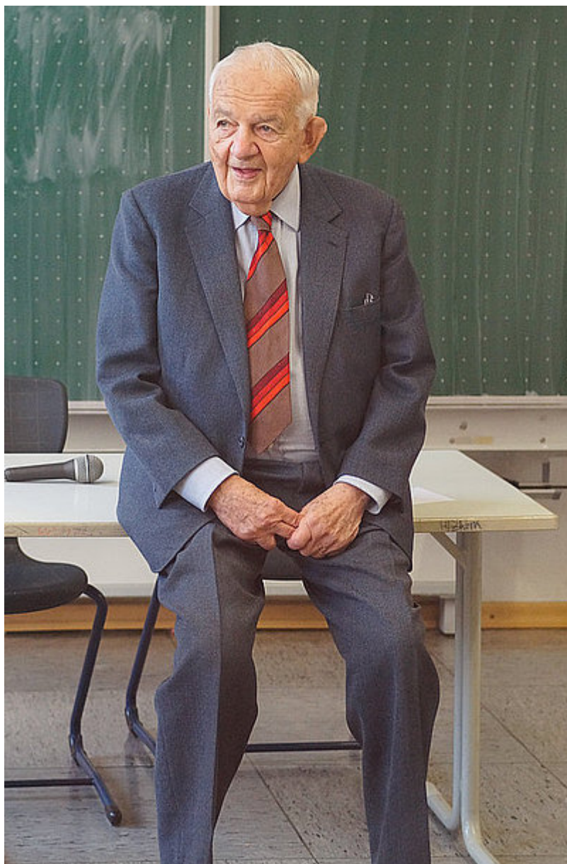
Alfred Grosser lors d'une rencontre avec des élèves au Mörrike-Gymnasium de Ludwigsburg organisée par le dfi en 2015