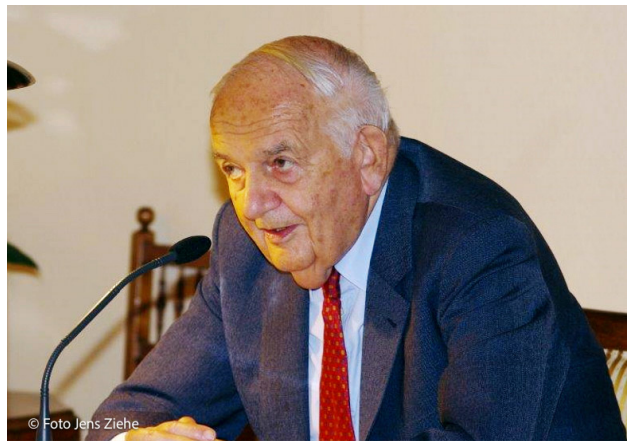
Alfred Grosser en 2011 lors d'une conférence au dfi

En 2003 quand nous avons lancé ensemble l'idée d'une coopération parlementaire franco-allemande qui finirait un jour par devenir l'Assemblée parlementaire franco-allemande, il a contacté le Président Thierse du Bundestag. Mais nous sommes aussi allés ensemble sonder les cœurs dans les Länder, et sur le terrain. Au dfi à Ludwigsburg, il était à la maison, depuis 1949. Il savait que sans les sociétés, sans impliquer les hommes et les femmes qui les font vivre, la grande œuvre du rapprochement franco-allemand ne serait pas durable.