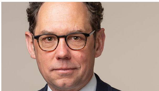
INTERLOCUTEUR · RICE

Au dfi, nous nous sentons redevables à Alfred Grosser et à ce que nous avons accompli ensemble. Les relations franco-allemandes, que Grosser a si fortement marquées de son empreinte depuis 1948, nécessitent encore aujourd'hui un échange permanent, la possibilité d'une expérience personnelle et une activité de transmission de connaissances. Nous nous inspirons ici de la pensée d'Alfred Grosser, qu'il a développée dans son dernier grand livre « Le Mensch. Éthique des identités ». L'empathie et la compréhension envers les autres, leurs problèmes et leur vécu, constituent le point de départ et d'arrivée d'une activité de médiation réussie. Alfred Grosser est décédé le 7 février 2024. Nous nous souviendrons de son sourire.