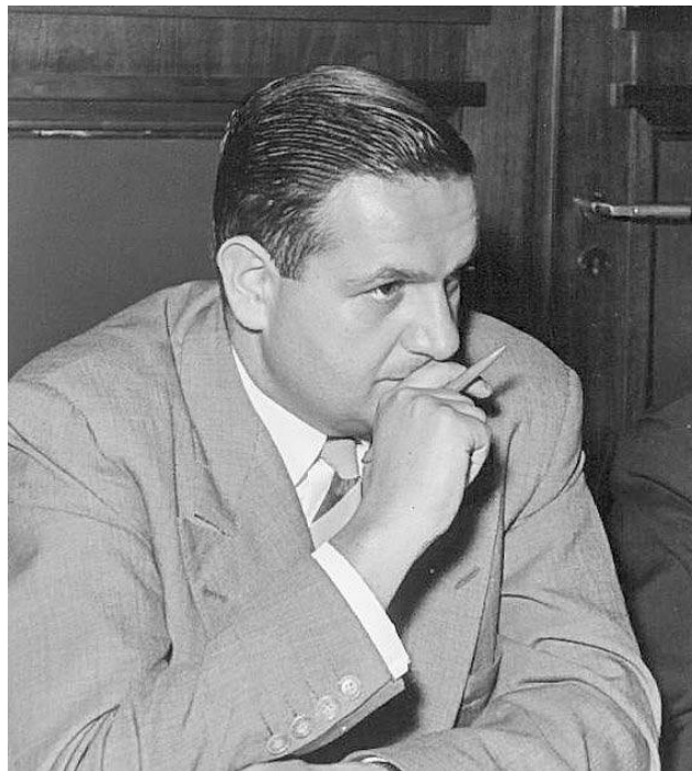
Alfred Grosser lors d'une rencontre des politiciens français et allemands à Bad Neuenahr en 1956

Au cours des dernières décennies, Alfred Grosser a souvent été invité chez nous en tant que conférencier. Certaines de ses conférences ont été enregistrées et converties en fichiers audio en 2020 :