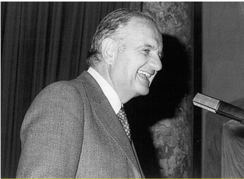
Alfred Grosser lors d'un discours au château de Ludwigsburg en 1982

Avec le traité de l'Élysée et la création de l'Office franco-allemand pour la jeunesse (OFAJ) en 1963 - que Grosser voyait d'un œil très critique car il craignait une mise sous tutelle des forces vives de la société civile et des responsables du travail avec les jeunes - son activité se déplaça de plus en plus vers le domaine universitaire. Sa chaire à l'Institut de sciences politiques parisiennes SciencesPo et son séminaire légendaire sur l'« actualité » ont acquis un statut culte. Ils ont constitué un passage obligé pour des générations d'étudiants. C'est là que Grosser a forgé sa propre méthode dialectique. Partant d'un article de journal de l'« autre » pays, il démontait les certitudes des étudiants et expliquait ensuite pourquoi un fait pouvait être vu de manière différente. Ce faisant, il était toujours animé par le désir de « comprendre » l'autre, de saisir pourquoi un point de vue totalement différent sur un même sujet pouvait être tout aussi valable et légitime que le sien, qu'il considérait pourtant comme certain.