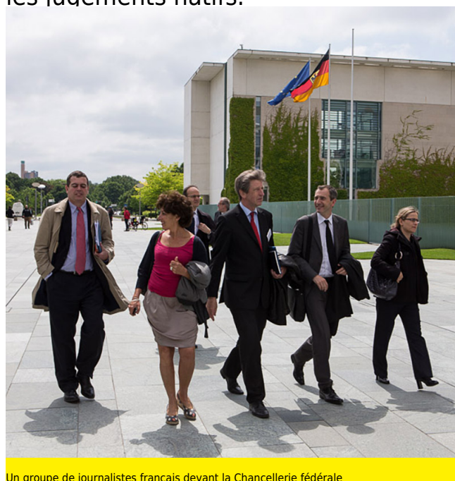
Un groupe de journalistes français devant la Chancellerie fédérale

La compréhension réciproque des Allemands et des Français risque toujours de s'enliser dans des images stéréotypées par l'information unilatérale, la perception partielle et les jugements hâtifs.