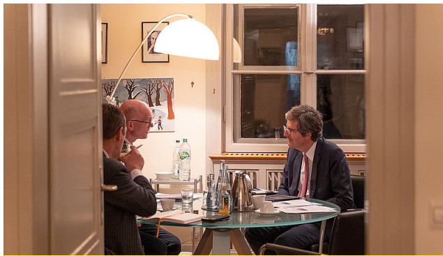
L'ambassadeur en discussion avec la presse

pays, fournir des informations fiables les uns sur les autres, favoriser la compréhension des perspectives nationales respectives : c'est là que le dfi commence son travail. Avec une moyenne de 200 interventions dans les médias par an, le dfi contribue au débat politique et social.