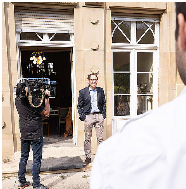
Jeunes du concours de Gaulle invités au dfi