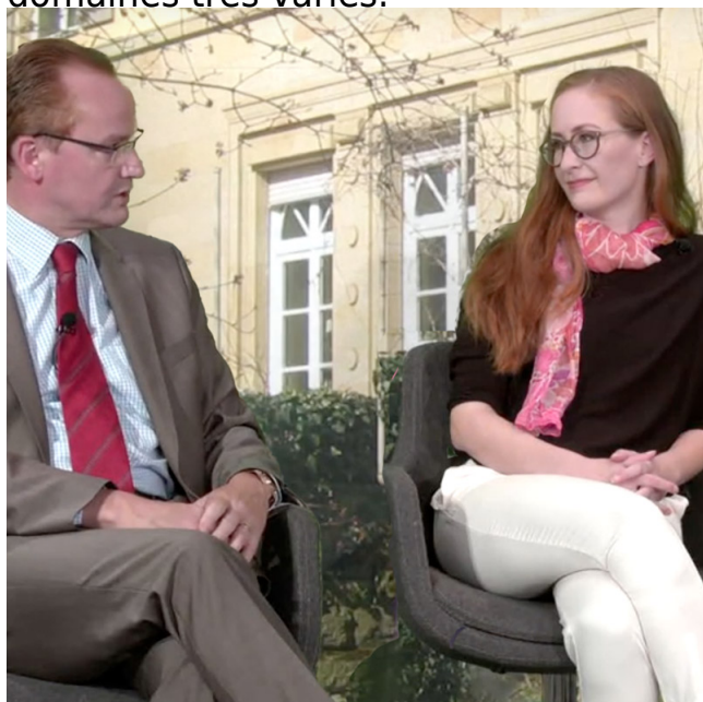
"dfi-journal", un nouveau format à côté des interviews à la télévision et la radio

La coopération internationale s'apprend - cela vaut aussi pour la coopération franco-allemande. Fort d'une longue expérience, le dfi apporte son soutien à des partenaires issus de domaines très variés.