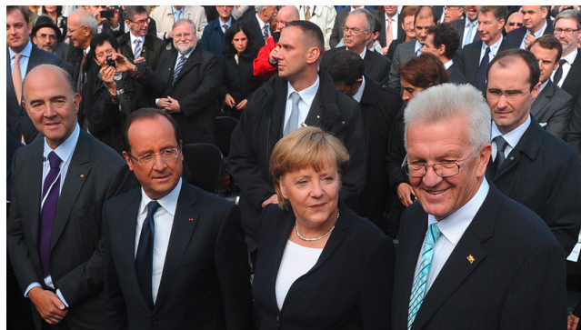
Célébration des 50 ans du discours de Gaulles à la jeunesse allemande : Bernard Cazeneuve, Pierre Moscovici, François Hollande, Angela Merkel et Winfried Kretschmann (de g. à d.)

« L'amitié franco-allemande est le meilleur exemple de la façon dont des décennies de conflits et de ressentiments peuvent être surmontées. »