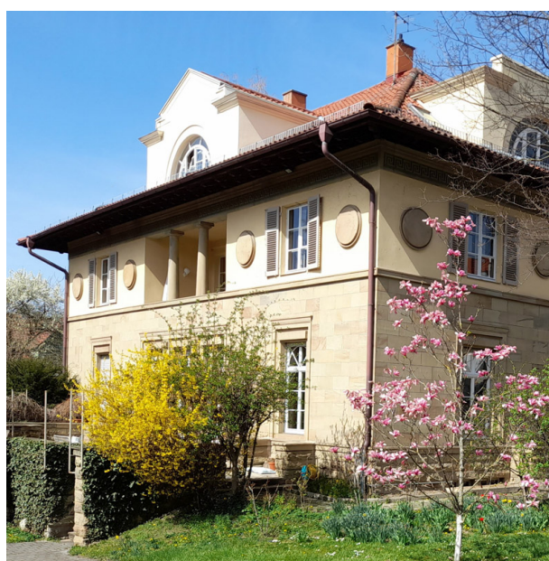
Villa Frischauer, siège de l'Institut Franco-Allemand de Ludwigsburg