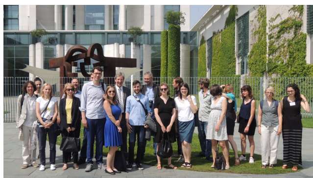
Des journalistes de France, d'Allemagne, d'Italie et de Pologne en voyage d'étude dans les quatre pays