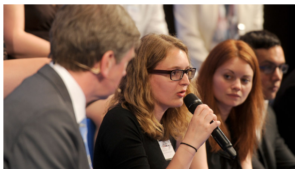
De jeunes Européens discutent de leurs attentes quant à l'avenir de l'UE