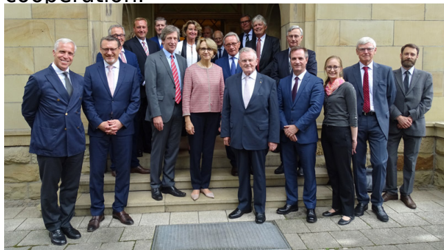
Donateurs lors de la visite de l'ambassadrice de France, Ludwigsburg 2018

Les relations franco-allemandes sont particulières. D'autres partenaires européens peuvent tirer parti de l'expérience acquise en matière de coopération.