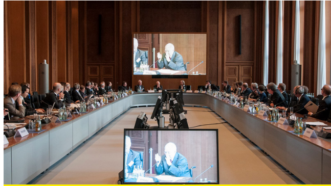
Conférence avec des économistes allemands et français au ministère fédéral des Finances avec le ministre Wolfgang Schäuble

En tant qu'institut de recherche non universitaire, le dfi traite des questions d'actualité dans les domaines de la politique, de l'économie et de la société. L'Institut contribue au débat scientifique par le biais d'articles spécialisés, de publications de livres et de conférences.