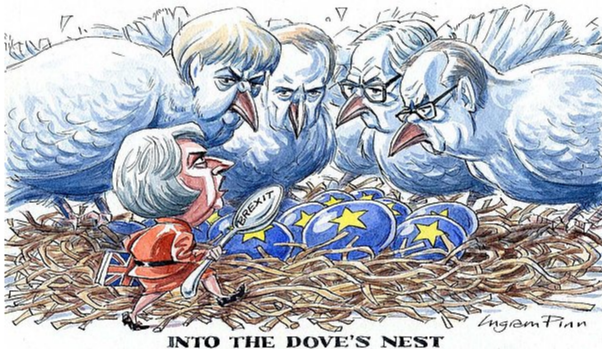
Caricature d'Ingram Pinn sur les négociations entre l'Union européenne et la Grande-Bretagne autour du Brexit (22/10/2016)

Entre 2000 et 2017, les relations franco-allemandes connaissent des difficultés récurrentes en raison de divergences sur la politique européenne, mais d'un autre côté, la coopération entre les deux pays permet de réaliser des progrès importants au niveau européen : L'euro est notamment introduit et l'intégration européenne approfondie par le traité de Lisbonne.