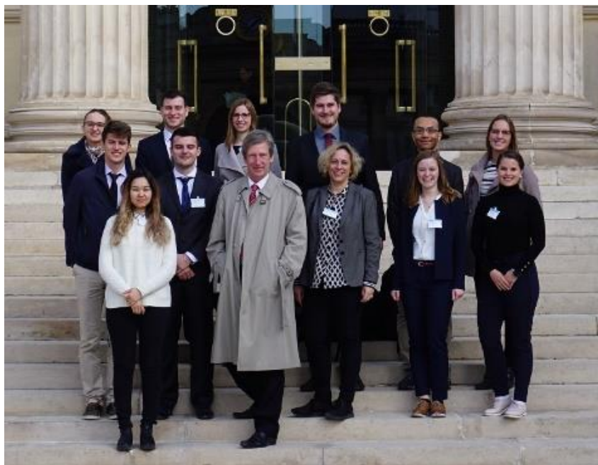
Vor der Assemblée Nationale @dfi