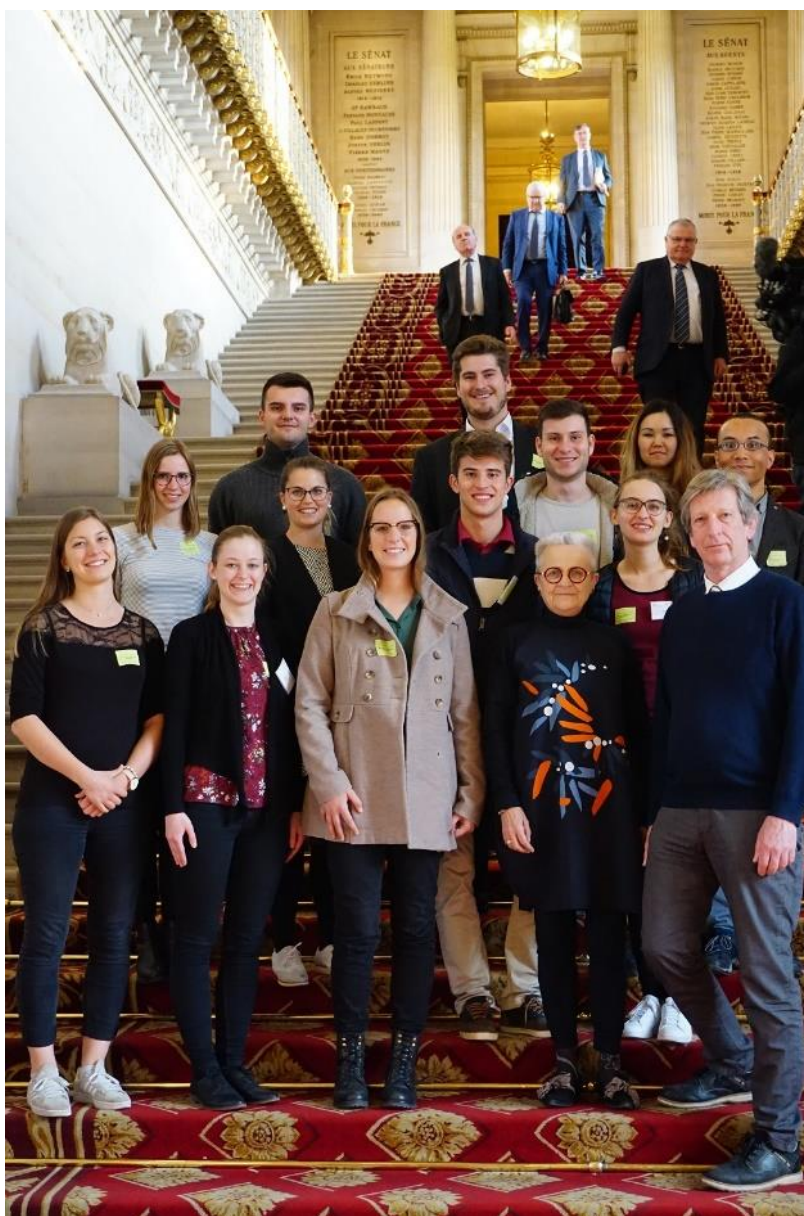
Im Senat mit Senatorin Gatel @dfi