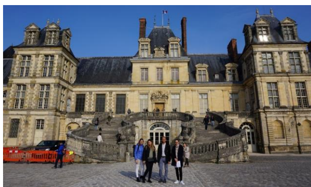
Schloss Fontainebleau