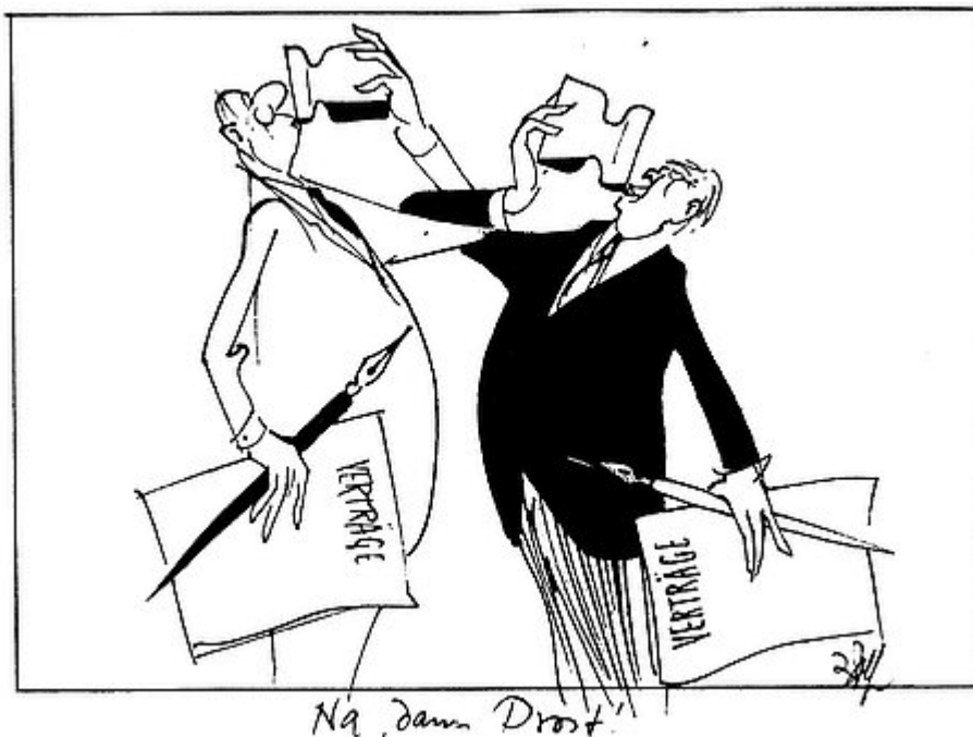
Karikatur von Fritz Wolf über den Abschluss des Élysée-Vertrags am 22. Januar 1963 (1949-1964)

Zwischen 1963 und 1974 durchliefen die deutsch-französischen Beziehungen Phasen der Entfremdung und der Wiederannäherung. Nach dem Abschluss des Élysée-Vertrags am 22. Januar 1963 galt es, seinen Inhalt in den gesellschaftlichen und politischen Alltag zu überführen. Diese Aufgabe übernahmen nach dem Ausscheiden Konrad Adenauers 1963 und Charles de Gaulles 1969 aus der Regierungsverantwortung Staatsmänner wie Ludwig Erhard und Willy Brandt auf deutscher und Präsident Georges Pompidou auf französischer Seite. Trotz unterschiedlicher Vorstellungen zu den transatlantischen Beziehungen oder der Fortentwicklung der Europäische Gemeinschaften gelang es immer wieder, Kompromisse zu finden und so gemeinsam Europa voranzubringen.