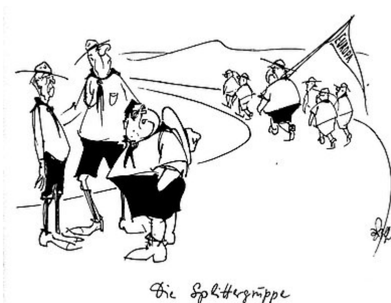
Karikatur von Fritz Wolf über die Fouchetpläne 1961 (Datum unbekannt)

1945 - 1963 Die Versöhnung im Zeichen des europäischen Einigungsprozesses