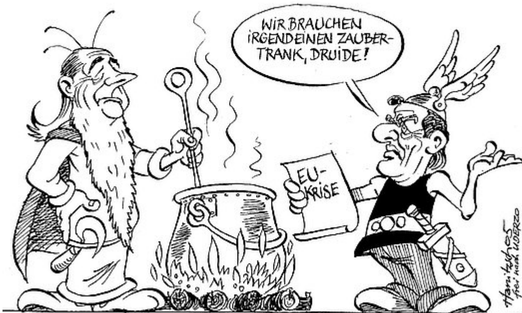
Asterix, der Kanzler