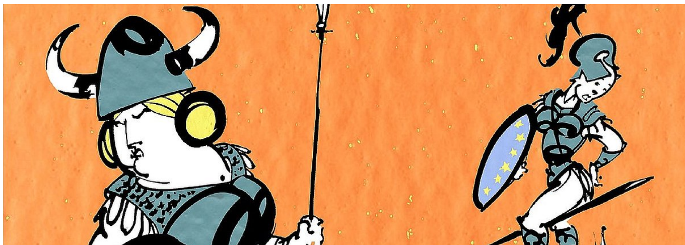
UE: comment l'Allemagne impose son modèle - Karikatur von BOLL, erschienen am 07. November 2011 in Les Echos © BOLL