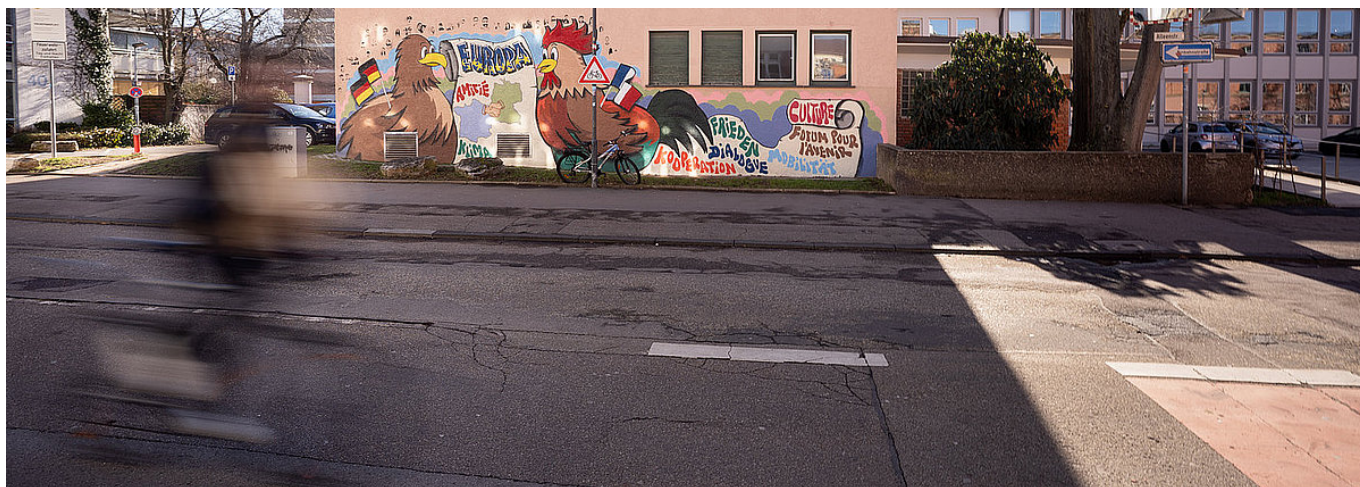
Ein Graffiti-Bild mit deutsch-französischer Thematik