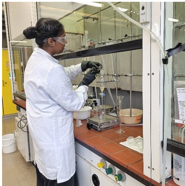
Eine Studierende des BiPaChem bei der Laborarbeit.