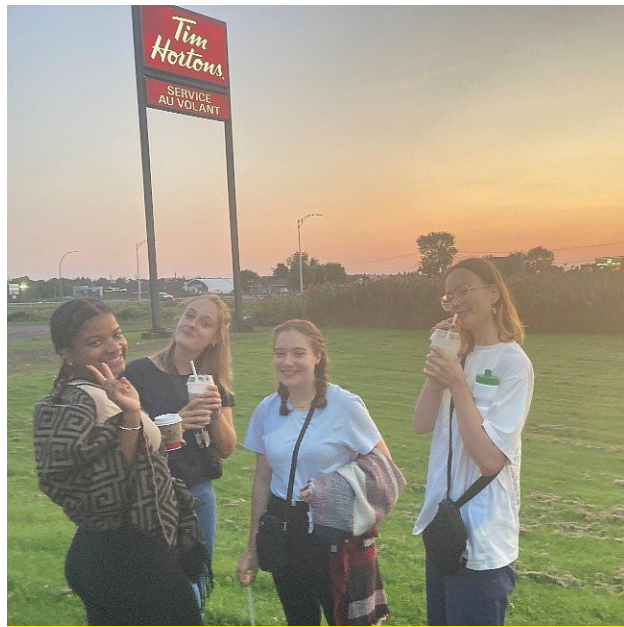
Studierende des integrierten Studiengangs Mainz-Dijon in Québec

Quoi de neuf - Nouvelles du bilingue - Alle Ausgaben von 2018 - 2025