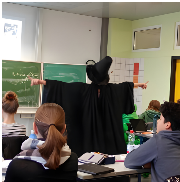
Ein Mitglied der Compagnie Brasse Brouillon in Aktion im Klassenzimmer.