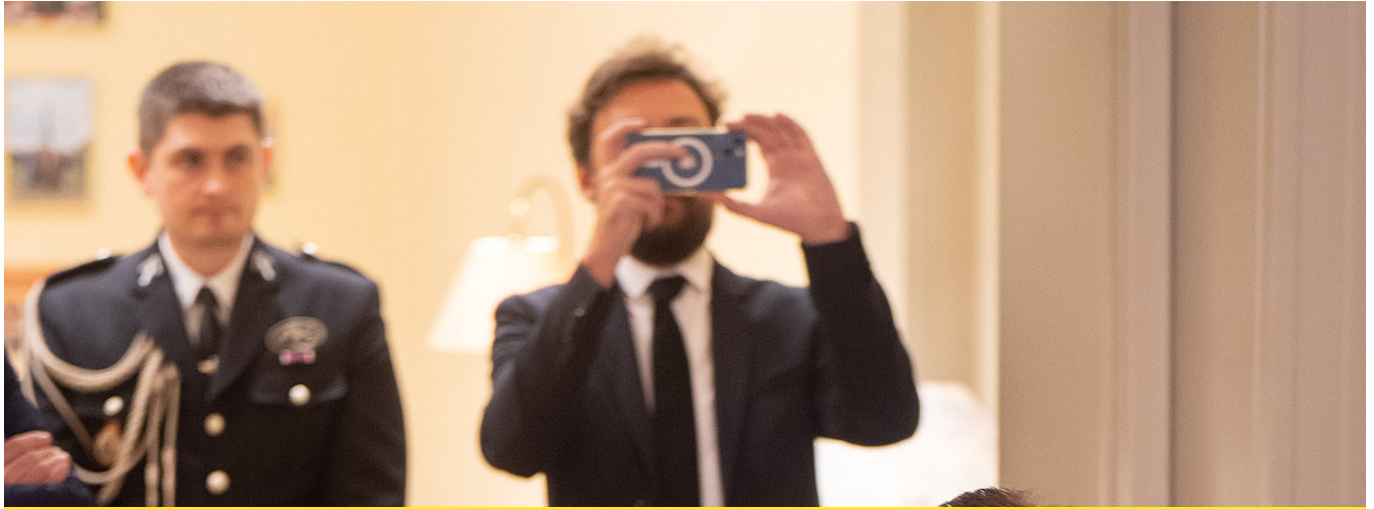
Ein Blick auf die Fotografen